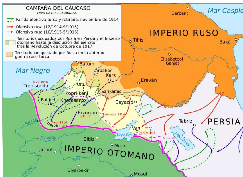
Figura 1 - As fronteiras entre Pérsia, Império Russo e Império Otomano antes da Primeira Guerra Mundial.

As cidades da região, que depois viriam a tornarem-se as capitais de Armênia, Azerbaijão e Geórgia já possuíam maioria armênia na época. Antes de se tornar um Estado independente, a população azeri era conhecida como “tártaros do Cáucaso” e antes da Primeira Guerra Mundial já haviam protagonizado um conflito com armênios. Na Figura 1 são ilustradas as fronteiras da região do Cáucaso na iminência da Primeira Guerra Mundial.